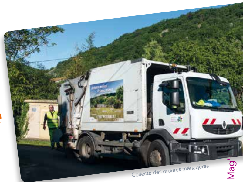
Collecte des ordures ménagères

bilité pour les périodes estivales et les semaines avec des jours fériés,