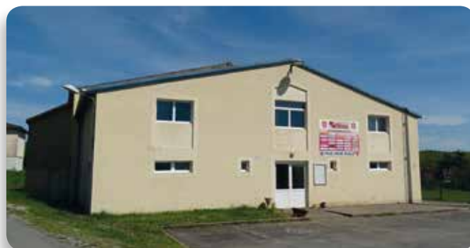
Gymnase actuel de Martel

afin d'assurer le financement de cette opération qui va être engagée prochainement.