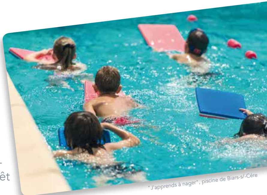
"J'apprends à nager", piscine de Biars-s./-Cère

↘ La Communauté de communes est compétente en matière de « construction, entretien et fonctionnement d'équipements culturels et sportifs d'intérêt communautaire ».