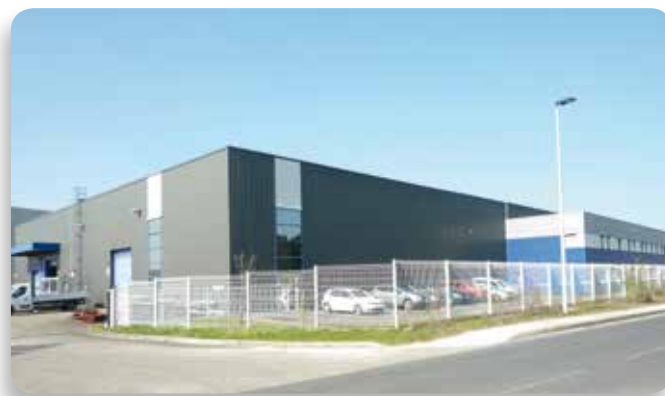
Le bâtiment de "Techniques et Formages"

↘ Ce secteur fait partie de la Mecanic Vallée qui s'étale sur 2 régions (Nouvelle-Aquitaine et Occitanie) et 4 départements (Aveyron, Lot, Corrèze et Haute-Vienne, mais aussi les parties limitrophes du Cantal et de la Dordogne Est) et sur 3 principaux secteurs d'activités en mécanique : l'aéronautique, l'équipement automobile et la machine-outil.