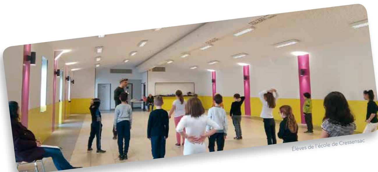
Élèves de l'école de Cressensac

Ce projet est la quatrième édition du Contrat Local d'Éducation Artistique sur le territoire. Le dispositif favorise les pratiques artistiques collectives. Il est soutenu à hauteur de 15 000€ par la Direction Régionale des Affaires Culturelles Occitanie, 3 000€ du ScénOgraph et 3 000€ de la Communauté de communes Causses et Vallée de la Dordogne. Ce soutien permet l'entière gratuité du projet pour tous les participants et de rémunérer les artistes. Le Théâtre de l'Usine et le Festival de Musique Sacrée de Rocamadour sont les deux opérateurs veillant au bon déroulement du projet sur le territoire. Le Théâtre de l'Usine met à disposition le lieu de spectacle et des logements pour les artistes, l'équipe est également en charge de la coordination avec les groupes du territoire.